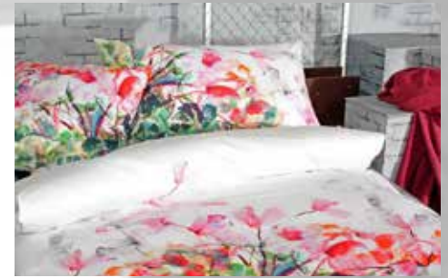
Selection 50.138.03 Doreen