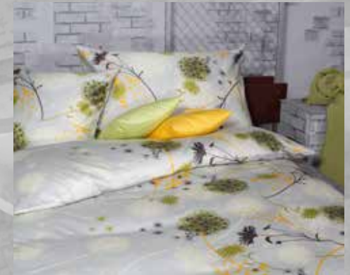
Selection 50.086.03 Alana