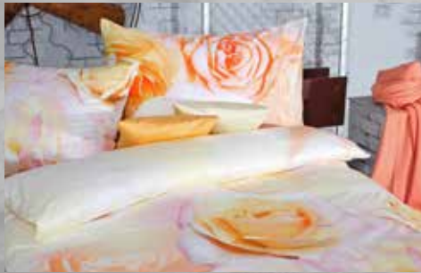
Selection 50.137.14 Rosella