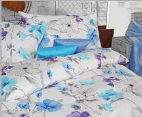
A Colori 51.141.02 Elina