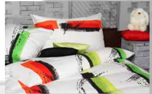
A Colori 51.134.03 Leonie