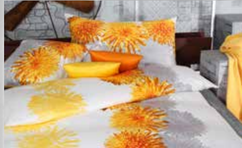
Selection 50.135.05 Soley