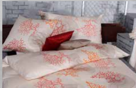
Selection 50.136.01 Aurelia