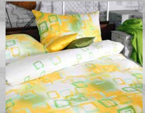
A Colori 51.148.03 Carmelo