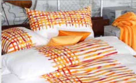
Selection 50.114.12 Xenia