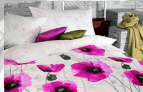
A Colori 51.132.15 Lucilla