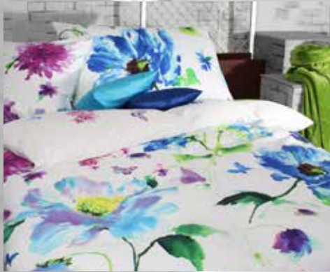
A Colori 51.145.02 Viktoria