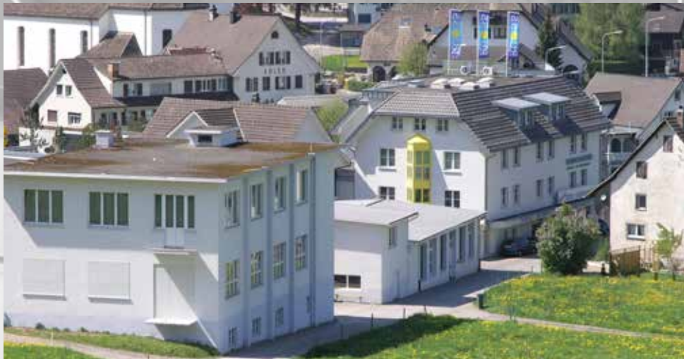
Südansicht unserer Firma in Schübelbach