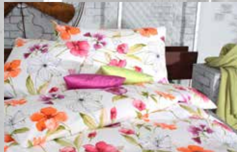
A Colori 51.141.12 Elina