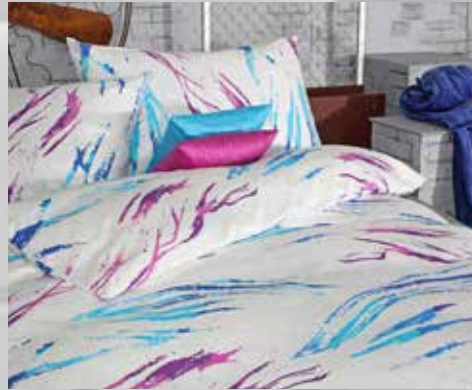
A Colori 51.147.02 Leyla