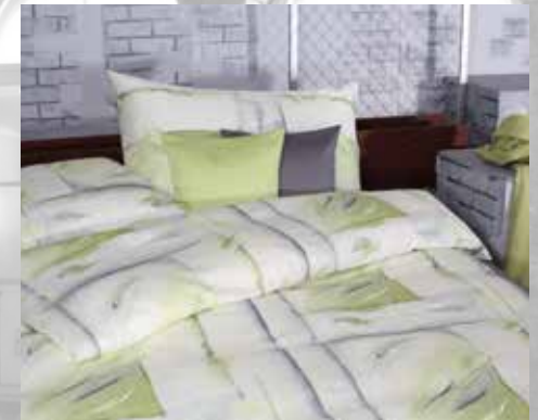
Emotion 10.141.33 Vulcano