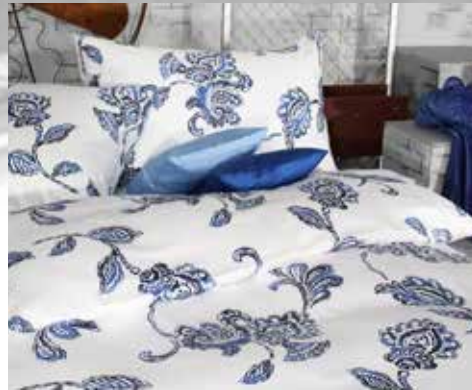
Selection 50.134.02 Melina