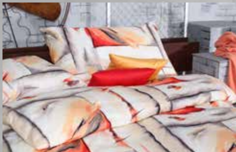
Emotion 10.141.01 Vulcano