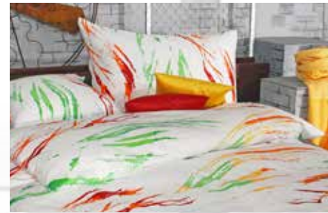
A Colori 51.147.12 Leyla