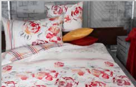
A Colori 51.146.01 Arabella