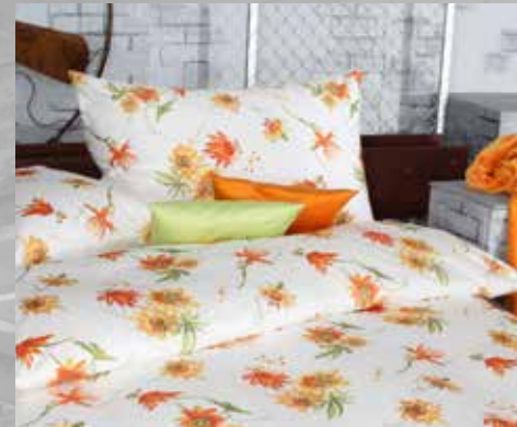
Emotion 10.198.12 Passiflora