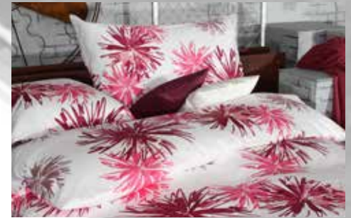
Selection 50.115.11 Rilana