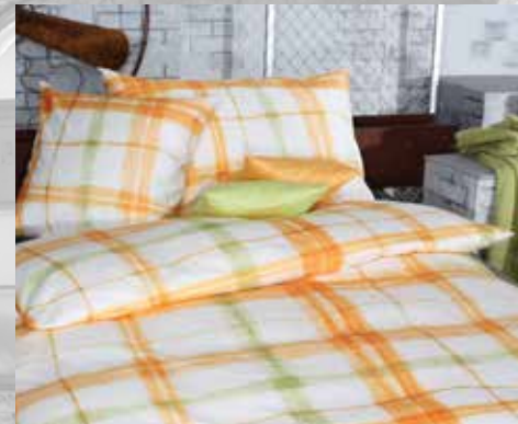
Emotion 10.199.12 Drops